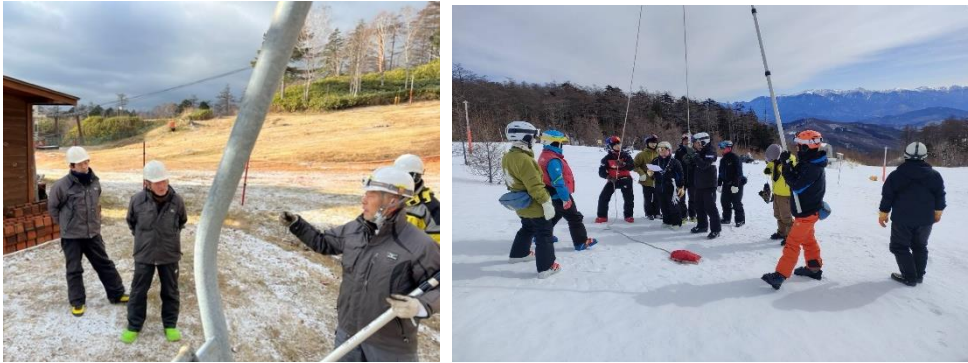
② (予備原動立上げ・運転訓練) 2022/12/1 第7クワッド、 2022/12/1 第5クワッド